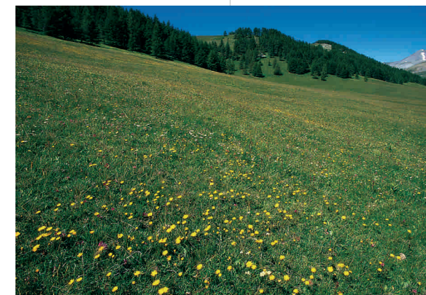
Le plateau de Longon

Si vedano anche la Scheda 6 e la Carta 1