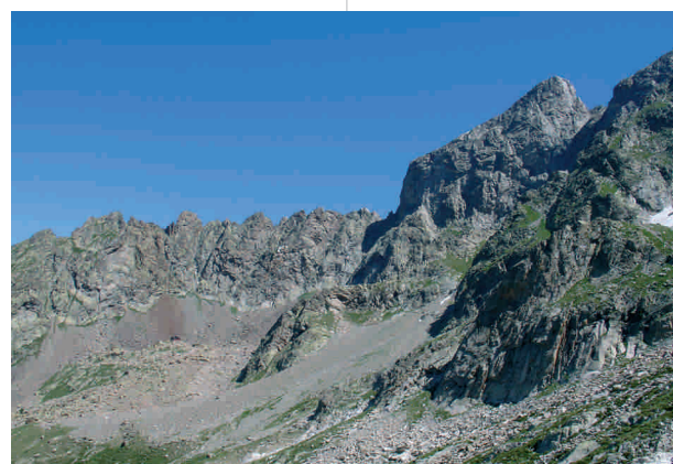
Le haut vallon de l'Argentera

des cas l'expression terminale des stations végétales, mais aussi parce qu'elles sont identifiables du premier coup d'œil, que ce soit sur le terrain ou sur la photographie aérienne. Un modèle fiable de cartographie systématique est offert par la carte CORINE, réalisée grâce au projet européen Corine Land Cover , qui utilise la télédétection par satellite comme source principale d'information. Cette cartographie au 1/100 000, avec un seuil minimal d'unités spatiales de 25 ha, permet d'obtenir des données objectives, facilement mises à jour, à un coût acceptable et suivant une nomenclature standard adoptée au niveau européen.