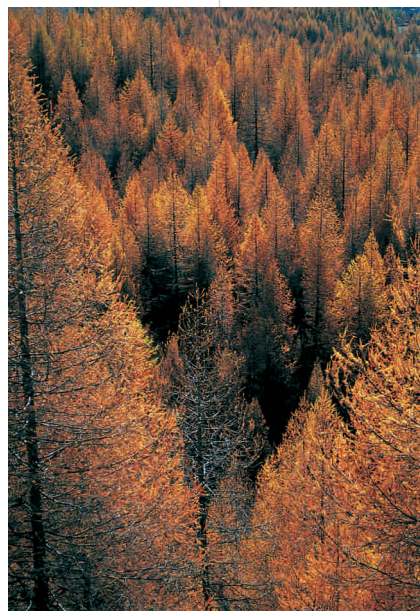
Forêt de mélèze

La hêtraie est la formation forestière principale, ce qui s'explique par la continentalité de la zone, sur plus de 4500 ha compris entre 850 et 1700 m d'altitude.