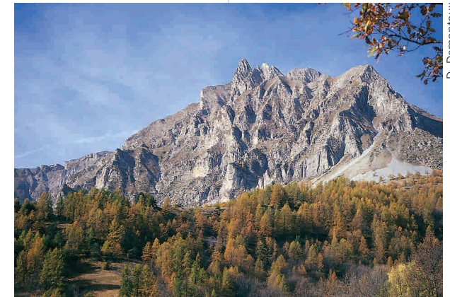
Les Aiguilles de Pelens

domine; à la montagne s'imposent des activités (ski, VTT, rafting, parapente) dans lesquelles l'aspect central est représenté par l'expérience corporelle personnelle, la beauté du paysage se transforme alors en facteur totalement marginal. La société post-moderne ne voit donc plus les Alpes comme un espace pour les loisirs, mais les considère à l'instar comme un terrain de jeu, où l'on peut mettre son corps à l'épreuve, mesurer ses forces. Dans le rapport à la montagne, l'aspect technique prend toujours plus d'importance – autant dans les formules d'entraînement que dans la qualité des matériaux- et les Alpes deviennent petit à petit un espace « artificiel », un gymnase en plein air dans lequel il existe une confrontation avec les autres et avec soi-même. Comment justifier les considérations exposées dans ce texte, qui se veut une courte introduction à l'Atlas du Patrimoine naturel et culturel de l'espace Alpi Marittime Mercantour? La perception de ce territoire a été fortement influencée par les trois « clefs d'interprétation » décrites ci-dessus, et il s'est ainsi créé une représentation qui n'est pas réaliste. Les Alpes Maritimes, avec leurs sommets de plus de trois mille mètres à proximité de la mer et leurs versants encore plus abrupts et escarpés que d'autres régions alpines- imaginons les voisines Alpes Ligures et Alpes Cozie- se prêtent assez bien à être perçues comme « montes horribiles », sinon comme lieu où la nature exprime toute sa beauté sauvage et majestueuse.