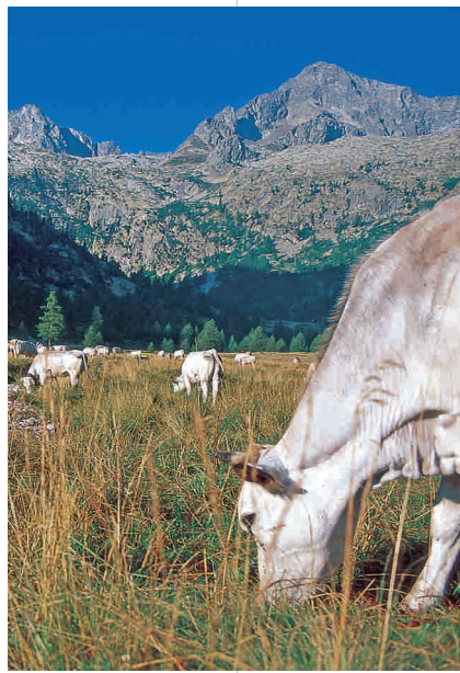
Bovins au Valasco