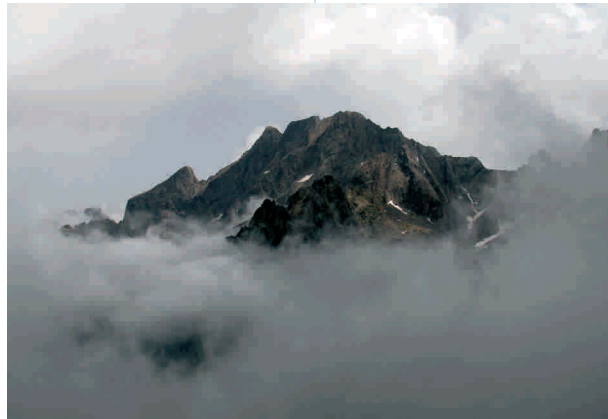
La Serra dell'Argentera qui sort de la mer de nuages