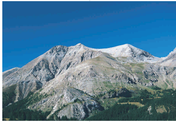
Le Mont Pelat

supérieur du Var, de la Tinée et de l'Ubaye, dont les vallées divergentes, profondément labourées par les glaciers, s'ouvrent majestueusement vers le ciel. La chaîne sédimentaire de la zone centrale est organisée le long d'une ligne de crête orientée nord-nord-ouest/sud-sud-est, creusée en profondeur par un réseau hydrographique divergent. Dans cet ensemble de cimes de modeste altitude (2400 m en moyenne) le Mont Mounier 2817 m fait figure de géant solitaire. Le bassin supérieur du Var incise profondément le Grès d'Annot. Il est entouré par un puissant rempart de hautes crêtes qui culminent avec le Mont Pelat 3050 m. De l'Authion jusqu'à Sospel, séparant la vallée de la Roya de celle de la Vésubie, s'étire une chaîne montagneuse de moyenne altitude. En proximité des gorges de Piaon (490 m), le parc touche son altitude la plus basse. Les vallées principales (Tinée, Var, Vésubie et Roya) sont pour la plupart étroites et créent des défilés et des gorges, comme ceux de Cians et de Daluis, de Valabres et de la Roya.