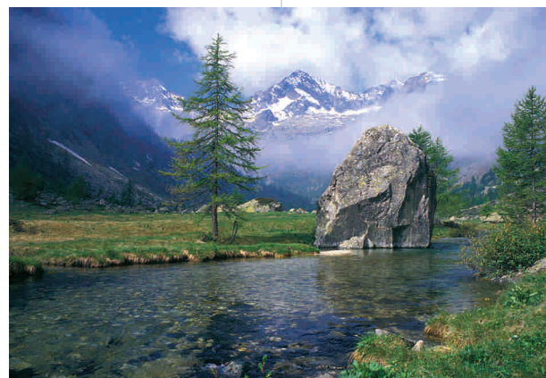
Le Plan de Valasco, antique bassin lacustre

La partie centrale des Alpes maritimes, appelée par les géologues Massif cristallin de l'Argentera, est constituée d'anciennes roches sédimentaires et éruptives. Durant l'orogénèse hercynienne (il y a 330 à 280 millions d'années) elles ont été transportées dans des zones profondes de la croûte terrestre où, sous l'action de températures et pressions très élevées, elles se sont transformées en roches métamorphiques de haut degré (gneiss, amphibolites, marbres) et en roches partiellement fondues (migmatites). La partie périphérique des Alpes maritimes est, au contraire, constituée de roches plus récentes, d'origine sédimentaire, qui se sont déposées pendant une durée très importante sur celles du massif cristallin et qui sont concernées exclusivement par le cycle orogénétique alpin (il y a 40 millions d'années à nos jours).