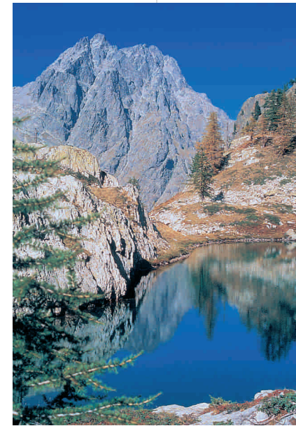
Le Mont Matto